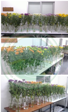
ทดสอบธาตุปุ๋ยแก่กับผลกบนกยูงขนาดที่ 1 สถาบันวิจัยและพัฒนาพื้นที่สูง อ.เมือง จ.เชียงใหม่