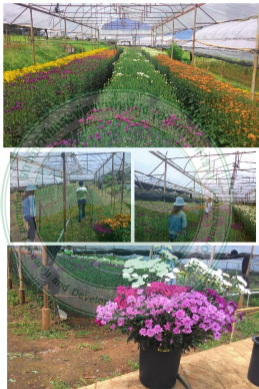
การเก็บเกี่ยวและบรรจุภาชนะดินเผาชำน้ำพันทิ ในโรงเรือนศูนย์ฯ ชุมวาง อ.แม่วาง จ.เชียงใหม่