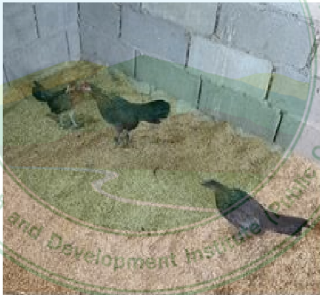
ภาพที่ 10 ไก่เพศเมียพื้นเมืองสายจอมทอง