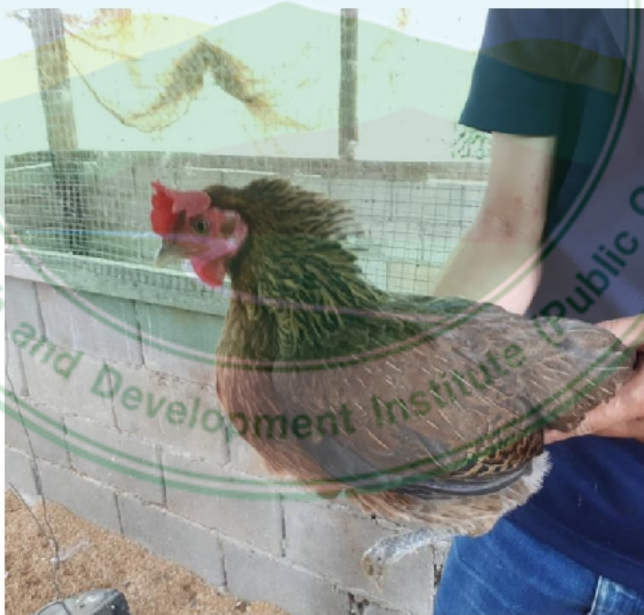
ภาพที่ 20 ไก่เพศเมียพื้นเมืองสายบ้านแม่สาบ-สะเมิง