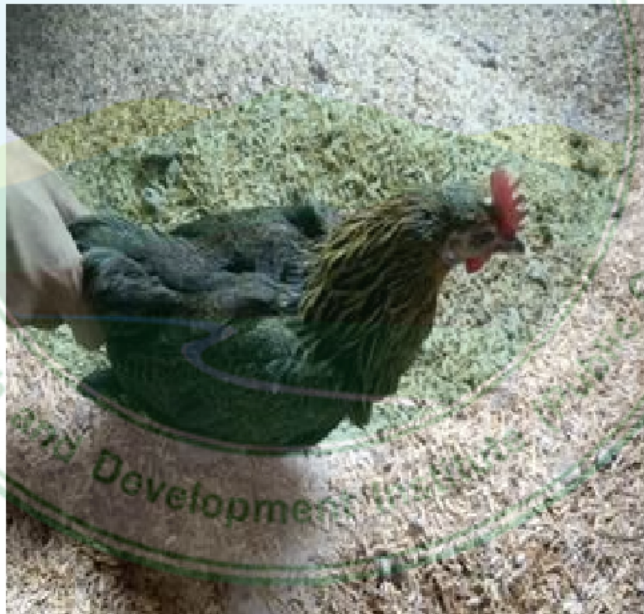
ภาพที่ 12 ไก่เพศเมียพื้นเมืองสายปางแดงใน เชียงดาว