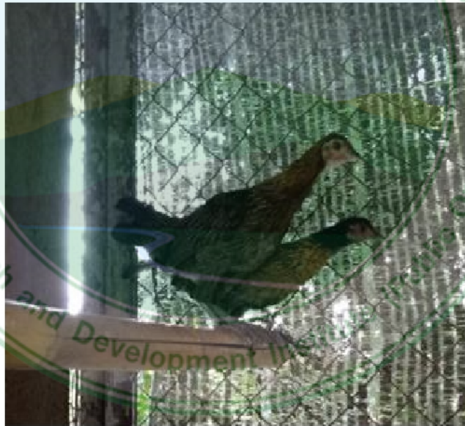
ภาพที่ 14 ไก่เพศเมียพื้นเมืองสายอินทนนท์