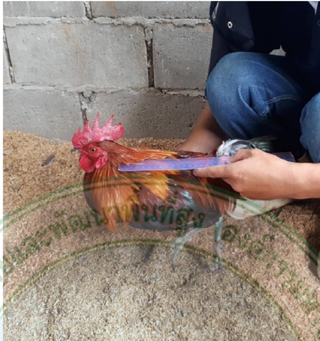
ภาพที่ 19 ไก่เพศผู้พื้นเมืองสายบ้านแม่สาบ-สะเมิง