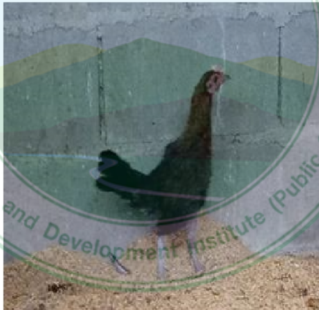
ภาพที่ 18 ไก่เพศเมียพื้นเมืองสายยังเมิน สะเมิง