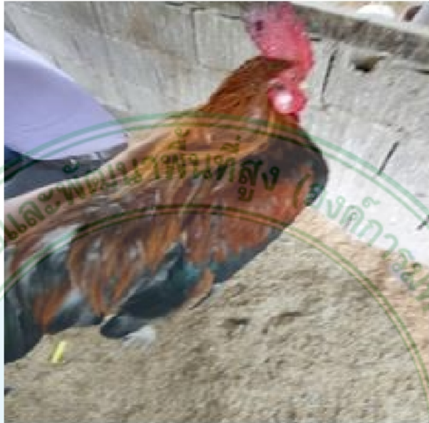
ภาพที่ 1 ไก่เพศผู้พื้นเมืองสายแม่ฮ่องสอน

ลักษณะไก่พื้นเมืองในพื้นที่ศึกษา 10 พื้นที่