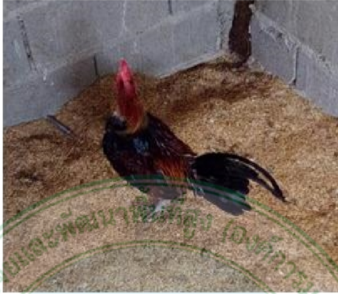
ภาพที่ 7 ไก่เพศผู้พื้นเมืองสายจอมทอง