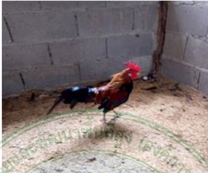
ภาพที่ 3 ไก่เพศผู้พื้นเมืองสายลี้ ลำพูน