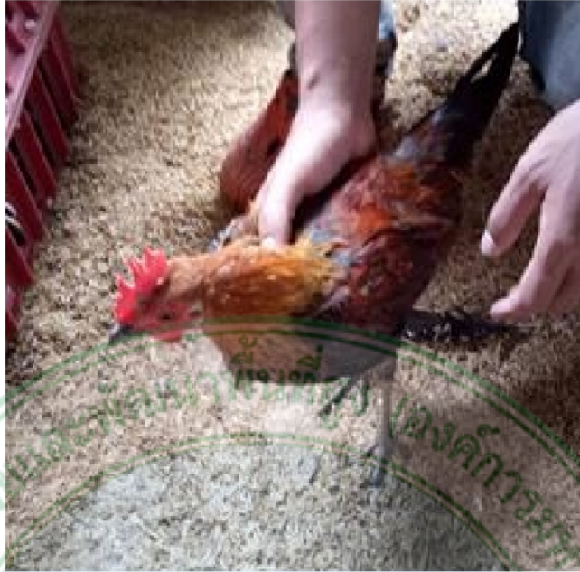
ภาพที่ 15 ไก่เพศผู้พื้นเมืองสายยังเมิน สะเมิง