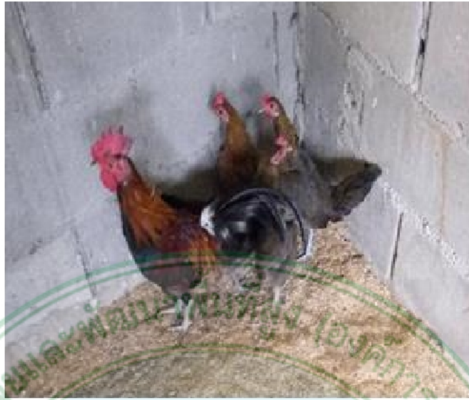
ภาพที่ 5 ไก่เพศผู้พื้นเมืองห้วยน้ำกั้น เชียงราย