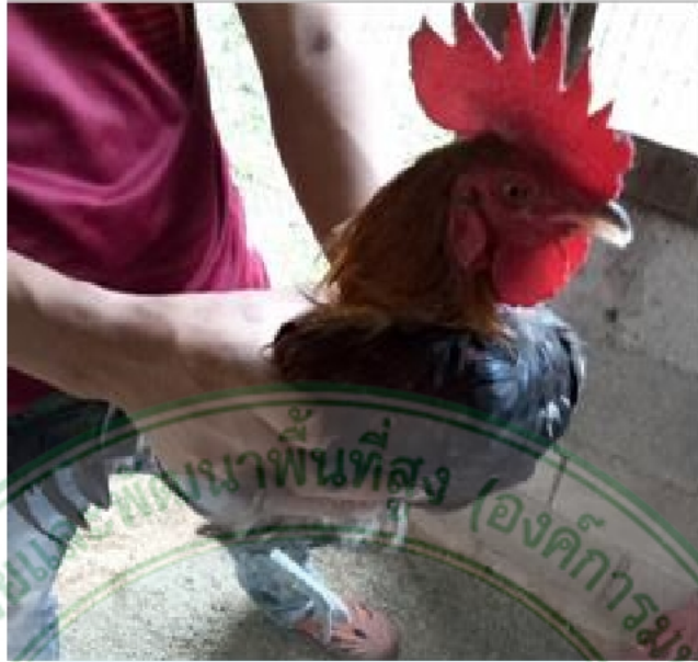
ภาพที่ 17 ไก่เพศผู้พื้นเมืองสายยังเมิน สะเมิง