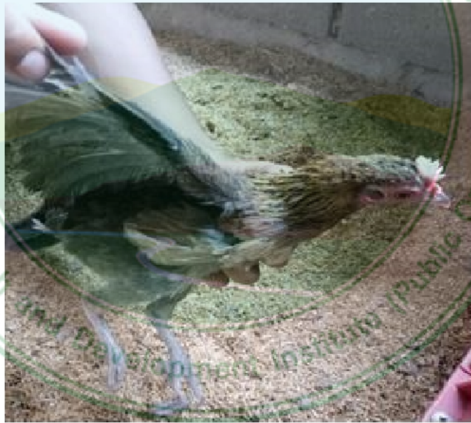
ภาพที่ 8 ไก่เพศเมียพื้นเมืองสายจอมทอง