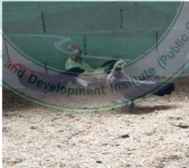
ภาพที่ 2 ไก่เพศเมียพื้นเมืองสายแม่ฮ่องสอน