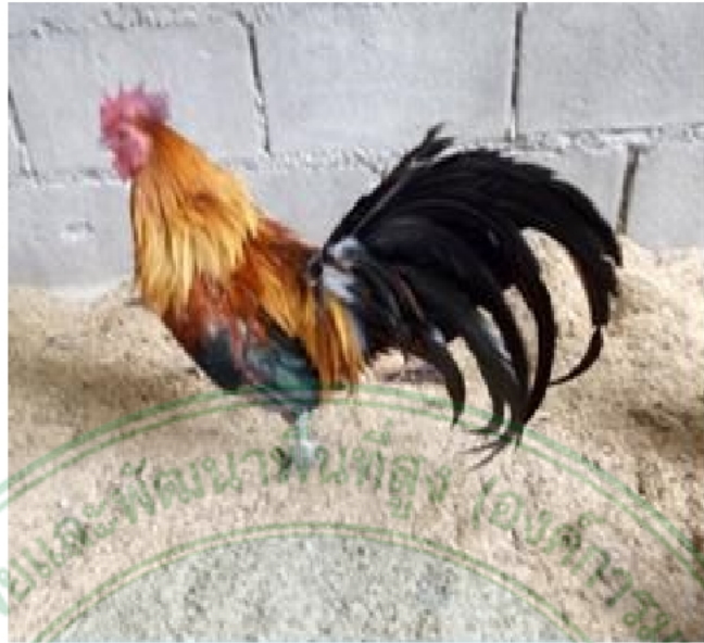
ภาพที่ 11 ไก่เพศผู้พื้นเมืองสายปางแดงใน เชียงดาว