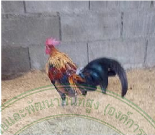
ภาพที่ 9 ไก่เพศผู้พื้นเมืองสายจอมทอง