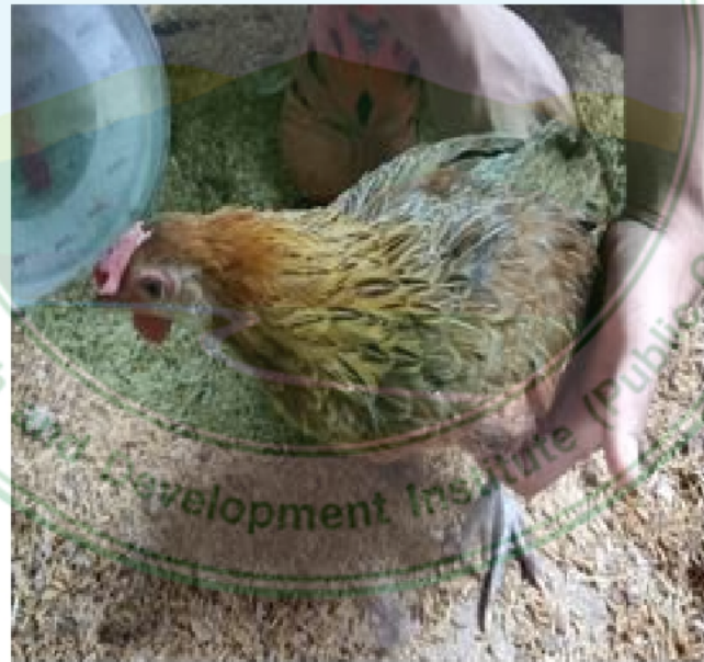
ภาพที่ 16 ไก่เพศเมียพื้นเมืองสายยังเมิน สะเมิง