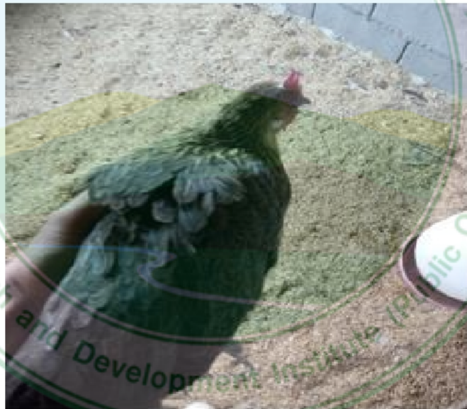
ภาพที่ 4 ไก่เพศเมียพื้นเมืองสายลี้ ลำพูน