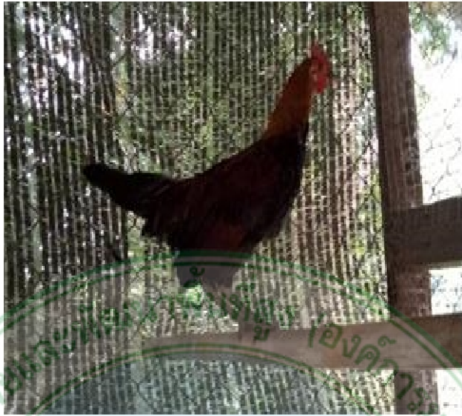
ภาพที่ 13 ไก่เพศผู้พื้นเมืองสายอินทนนท์