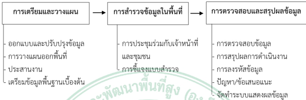
ภาพ 7.1 การสำรวจข้อมูลพื้นฐานรายครัวเรือนในพื้นที่โครงการหลวง

คู่มือการสำรวจข้อมูลรายครัวเรือนในพื้นที่โครงการหลวงได้รวบรวมขั้นตอน และประเด็นการสำรวจข้อมูลรายครัวเรือนในพื้นที่ของศูนย์พัฒนาโครงการหลวง โดยมีประเด็นต่างๆ ได้แก่ 1) การเตรียมและการวางแผน ประกอบด้วย การออกแบบและปรับปรุงข้อมูล การวางแผนการสำรวจ การประสานงานกับหน่วยงานต่างๆที่เกี่ยวข้อง การเตรียมข้อมูลพื้นฐาน 2) การสำรวจข้อมูลในพื้นที่ ประกอบด้วย การประชุมร่วมกับเจ้าหน้าที่และชุมชน การชี้แจงแบบสอบถามก่อนสำรวจ 3) การสรุปผลและการตรวจสอบข้อมูล ประกอบด้วย การตรวจสอบข้อมูล การสรุปการดำเนินงาน การลงรหัสข้อมูล ปัญหาและข้อเสนอแนะ การจัดทำระบบแสดงผลข้อมูล รวมไปถึงประเด็นปัญหาและอุปสรรค และการถอดบทเรียนจากการสำรวจ (ภาพ 7.1) โดยมีรายละเอียดของคู่มือการสำรวจ ดังนี้