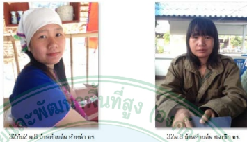
ภาพ 7.10 รูปเกษตรกร

อันดับสุดท้ายเมื่อสัมภาษณ์เสร็จให้ถ่ายรูปผู้สัมภาษณ์ และเปลี่ยนชื่อไฟล์ตามบ้านเลขที่ หมู่ ที่ ชื่อหมู่บ้าน ระบุเป็นหัวหน้าครัวเรือนหรือสมาชิกครัวเรือน (ภาพ 7.10)