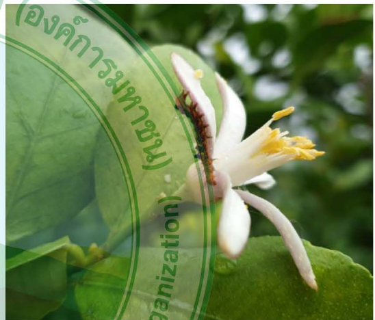
หนอนนึ่ง