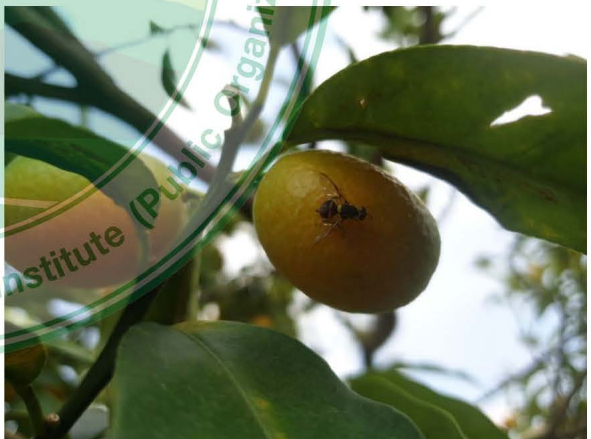
แมลงวันทองในส้มคัมควัท