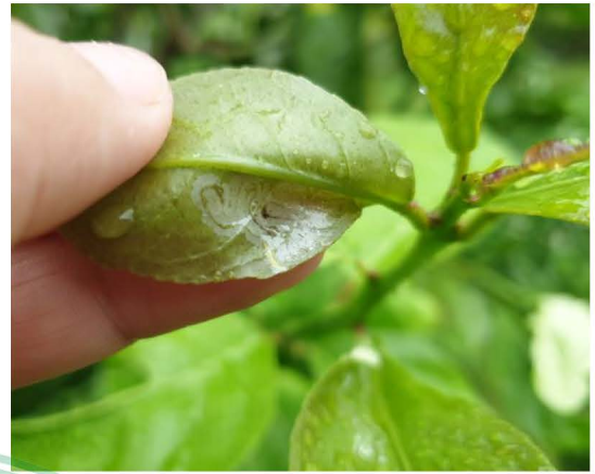
หนอนซอนใบส้ม