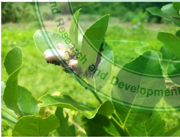
เพลี้ยอ่อนและมด