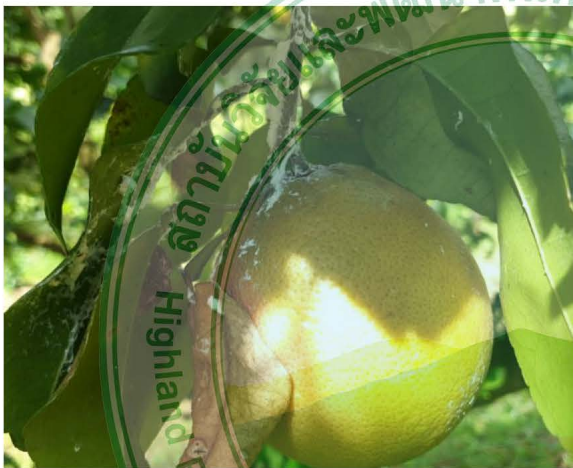
เพลี้ยแป้ง