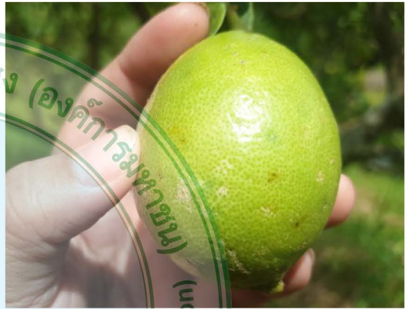
เพลี้ยไฟทำลายที่ผล