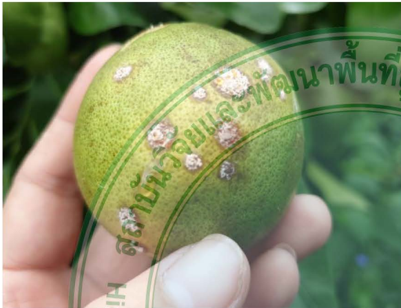
โรคสแครปหรือแมลงสะเก็ดของเกรฟฟรุต