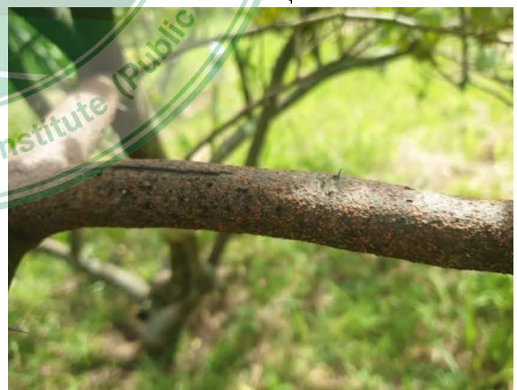
เพลี้ยหอย