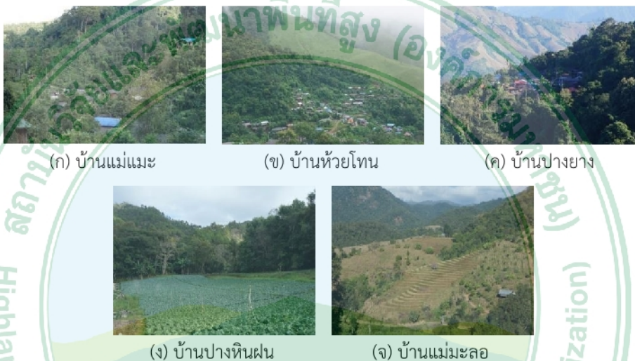
ภาพที่ 1 สภาพพื้นที่ศึกษาแต่ละรูปแบบภูมิสังคม (ก) ชุมชนป่าเมี่ยง (ข-ค) ชุมชนที่ปลูกข้าวเป็นหลัก (ง-จ) ชุมชนที่มีฐานจากการปลูกฝิ่น

1. คัดเลือกพื้นที่นำร่องศึกษาตามบริบทภูมิสังคม 5 พื้นที่ ประกอบด้วย ชุมชนป่าเมี่ยง 1 พื้นที่ ได้แก่ บ้านแม่เมะ โครงการพัฒนาพื้นที่สูงแบบโครงการหลวงปางมะโอ ชุมชนที่ทำนาข้าวเป็นหลัก 2 พื้นที่ ได้แก่ บ้านห้วยโตน โครงการพัฒนาพื้นที่สูงแบบโครงการหลวงบ่อเกลือ และ บ้านปางยาง โครงการพัฒนาพื้นที่สูงแบบโครงการหลวงปางยาง ชุมชนที่มีฐานจากการปลูกฝิ่น 2 พื้นที่ ได้แก่ บ้านแม่มะลอ โครงการพัฒนาพื้นที่สูงแบบโครงการหลวงแม่มะลอ และบ้านปางหินฝน โครงการพัฒนาพื้นที่สูงแบบโครงการหลวงปางหินฝน (ภาพที่ 1 ก-จ)