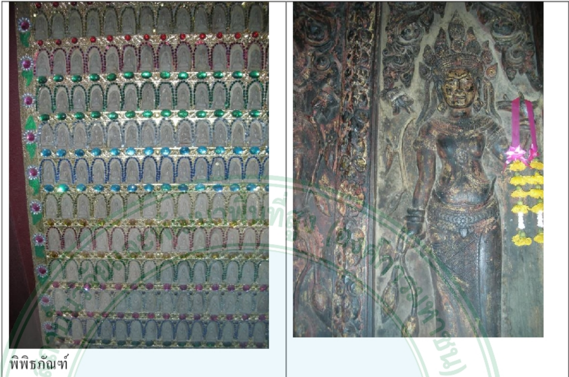
พิพิธภัณฑ