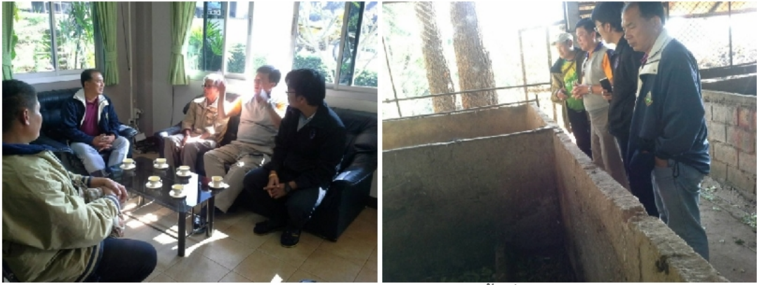
ภาพภาคผนวก ค. 1 การประชุมวางแผนการดำเนินงานและลงพื้นที่สำรวจความพร้อมในการทำวิจัย