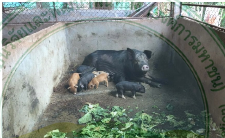
ภาพภาคผนวก ค. 7 สุกรระยะก่อนหย่านม