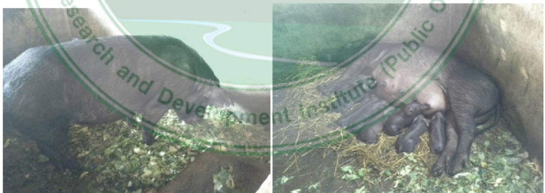
ภาพภาคผนวก ค. 3 สุกรพ่อแม่พันธุ์ผสมพื้นเมืองกับเหมยซาน (RPM) และ สุกรลูกผสมพื้นเมืองกับเหมยซาน (RPM)