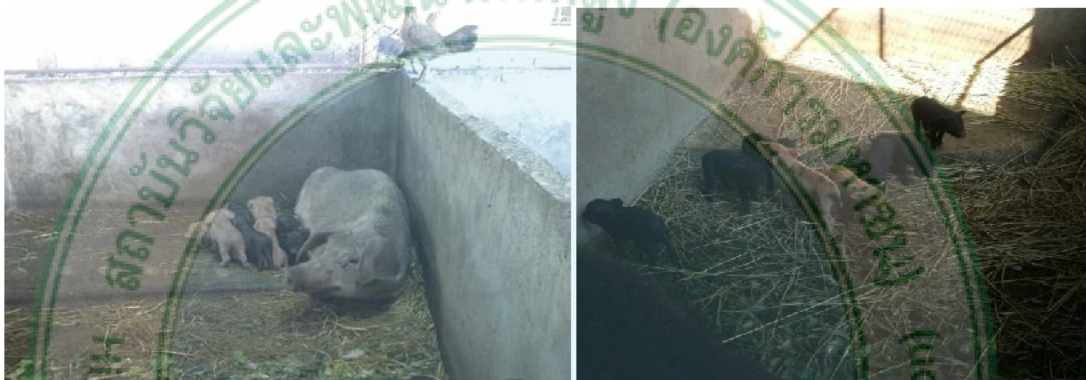
ภาพภาคผนวก ค. 2 สุกรพ่อแม่พันธุ์ผสมพื้นเมืองกับเป็ดแดง (RPP) และสุกรลูกผสมพื้นเมืองกับเป็ดแดง (RPP)