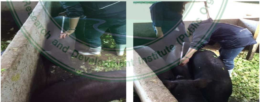
ภาพภาคผนวก ค. 11 การวัดความยาวลำตัวและความกว้างสะโพกของสุกร