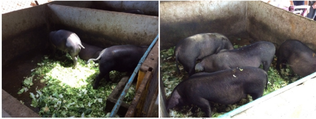
ภาพภาคผนวก ค. 6 การกินผักคัตติ้งของสุกร