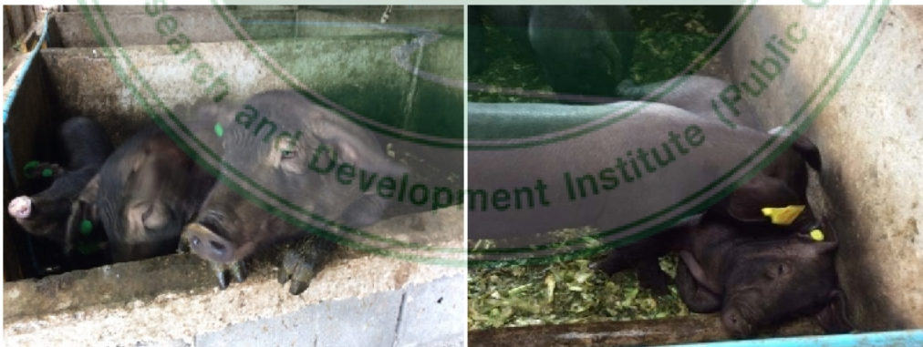
ภาพภาคผนวก ค. 8 สุกรระยะขุน